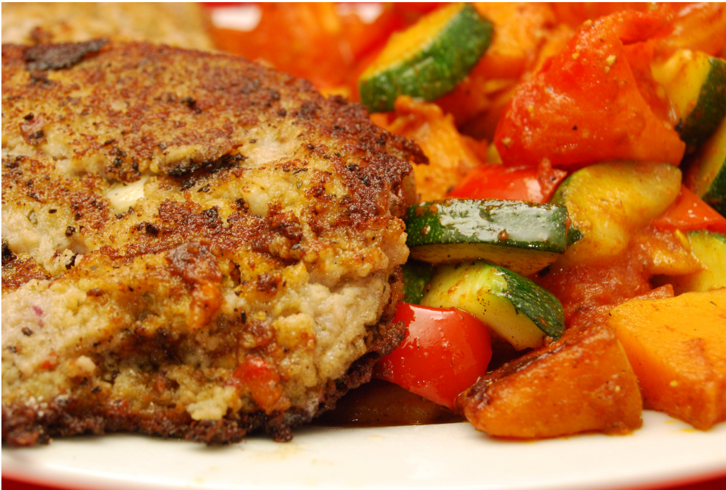
Frikadellen mit Gemüse

Ich hatte eine Packung Nürnberger Rostbratwürste übrig. Einfach in der Pfanne in Fett zubereiten wollte ich sie nicht, das war mir zu einfach und macht man ja meistens.