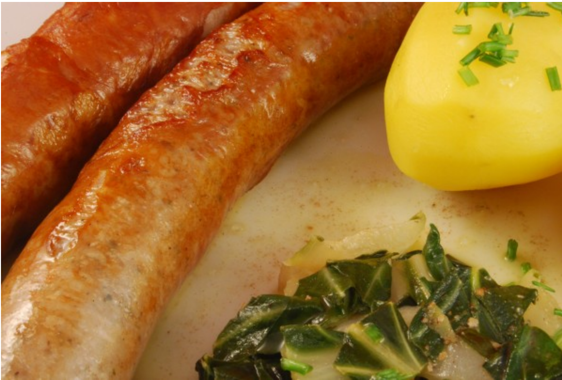
Wurst, Mangold, Kartoffel

Heute ein einfaches Essen, keine lange und umfangreiche Vorbereitung und eine einfache und schnelle Zubereitung. Und Bratwürste – ob fein oder grob –, die ich selten zubereite, sind ja wirklich sehr preiswert. 4 € pro Kilo, und für zwei Würste für eine Person zahlt man ein wenig über 1 €. Da Kinder Bratwürste immer gerne essen, sind sie gut geeignet für den familiären Küchenplan von Hausfrauen/-männern.