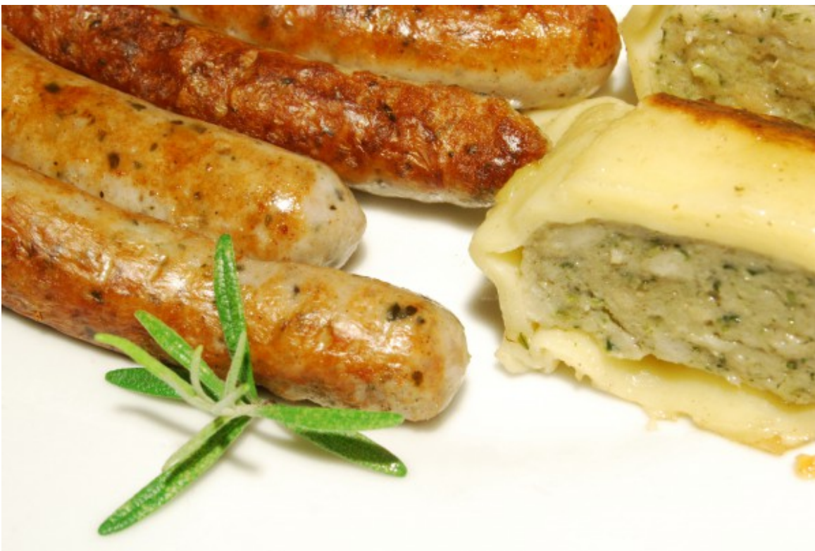
Würste mit Maultaschen

Jetzt habe ich doch glatt Uli Hoeneß unterstützt. Zwar indirekt, weil ich die Würste nicht selbst gekauft habe, aber doch finanziell. Wie er wohl diese finanziellen Einnahmen während seiner Haftzeit verwenden wird? Es handelt sich um Nürnberger Bratwürste, nein, ich muss sie genauer benennen, „Original Nürnberger“ der Firma HoWe Wurstwaren KG. Das „HoWe“