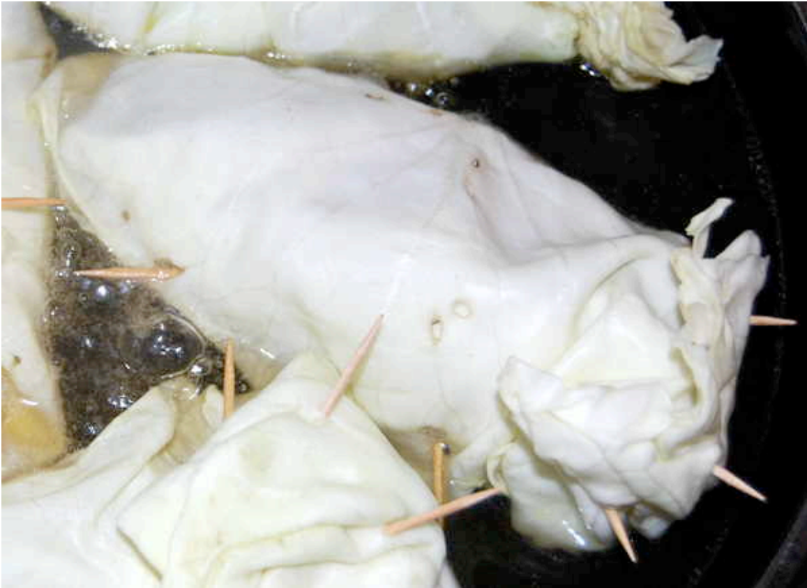
Gefüllte Weißkohlblätter in der Pfanne im Gemüsefond

Garzeit in einer Brühe, denn einerseits müssen die Weißkohlblätter gegart werden, andererseits aber auch das rohe Hackfleisch und das Gemüse. Außerdem gart in dieser Zeit der Bulgur/Couscous und zieht auch eine Menge Flüssigkeit aus der Brühe.