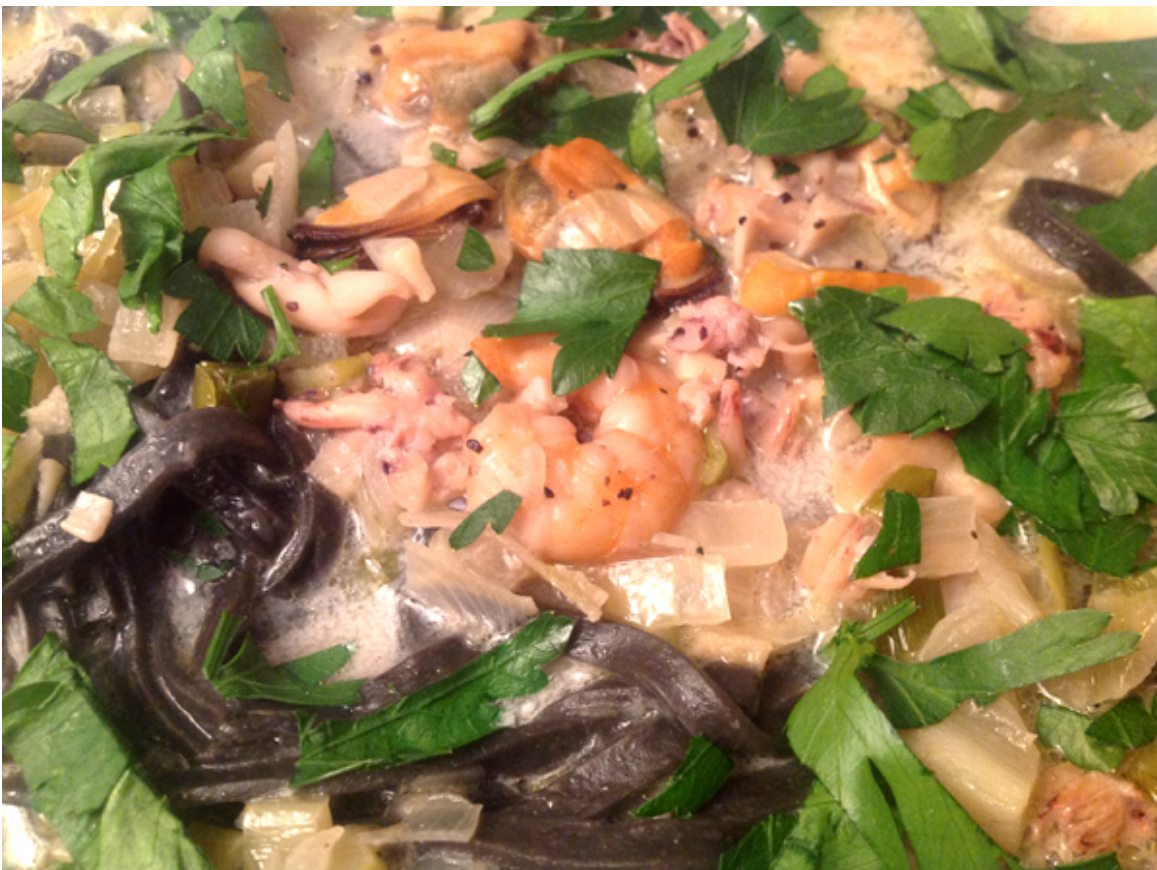
Tagliolini mit Meeresfrüchten – aufgenommen mit iPad3

Diesmal habe ich mich für schwarze Pasta entschieden – schwarz, weil sie mit Tintenfischtinte produziert wird. Sie riecht auch leicht nach Fisch und Meeresfrüchten, so dass sie auch nur damit serviert werden sollte. Das Rezept ist für zwei Personen.