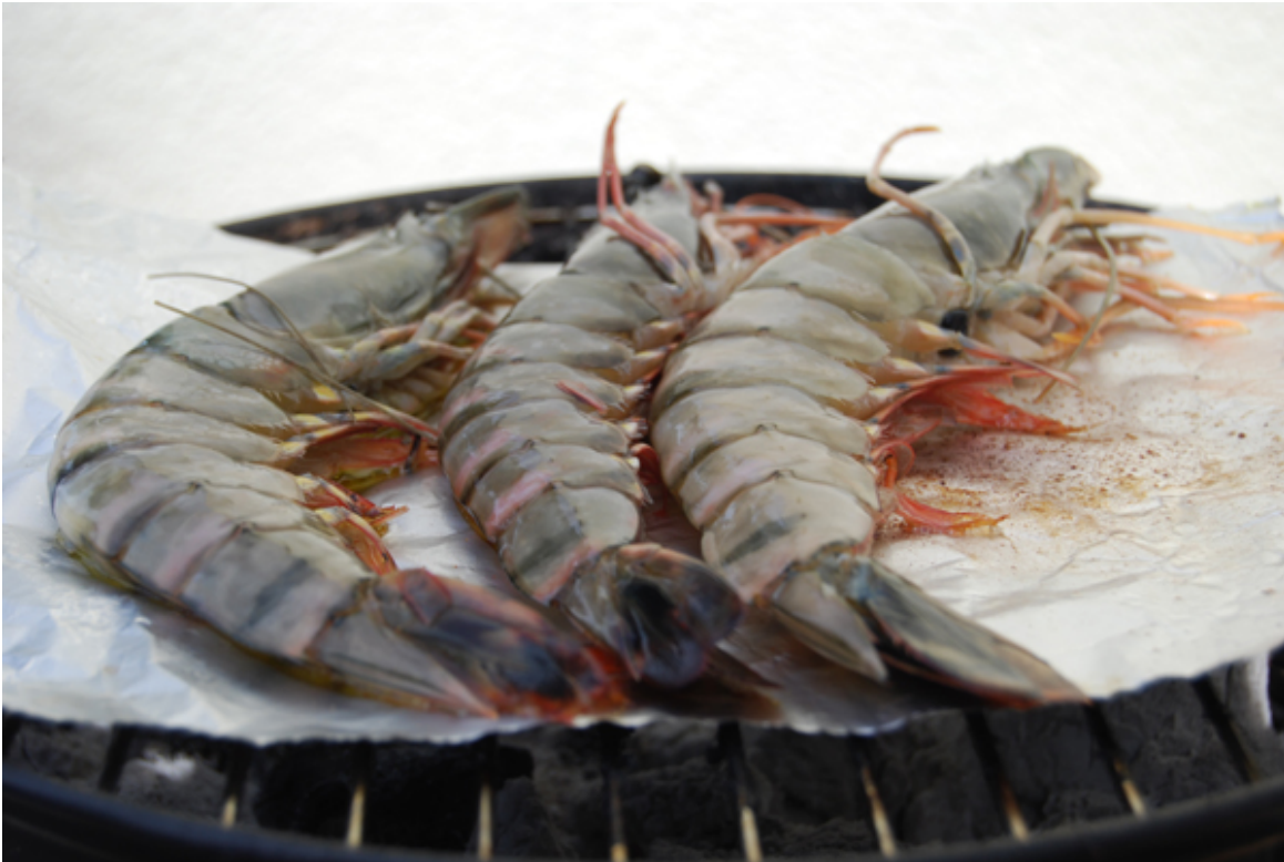
Drei frische Garnelen auf dem Grill

Die Garnelen, die ich eingekauft hatte, waren wirklich sehr groß, zumindest so groß wie eine Hand. Dementsprechend waren sie auch teuer. Aber sie waren wirklich sehr lecker. Einfach ein wenig Alufolie auf den Grill legen, dann ein wenig Olivenöl darauf geben und verstreichen und die Garnelen von beiden Seiten ca. 8–10 Min. grillen. Köstlich.