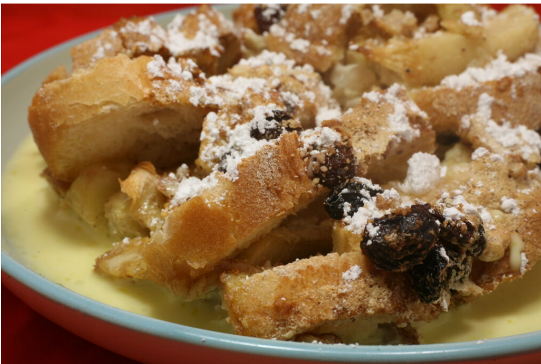
Eine schwäbische Spezialität

Zubereitungszeit: Vorbereitungszeit 20 Min. | Backzeit 35–45 Min.