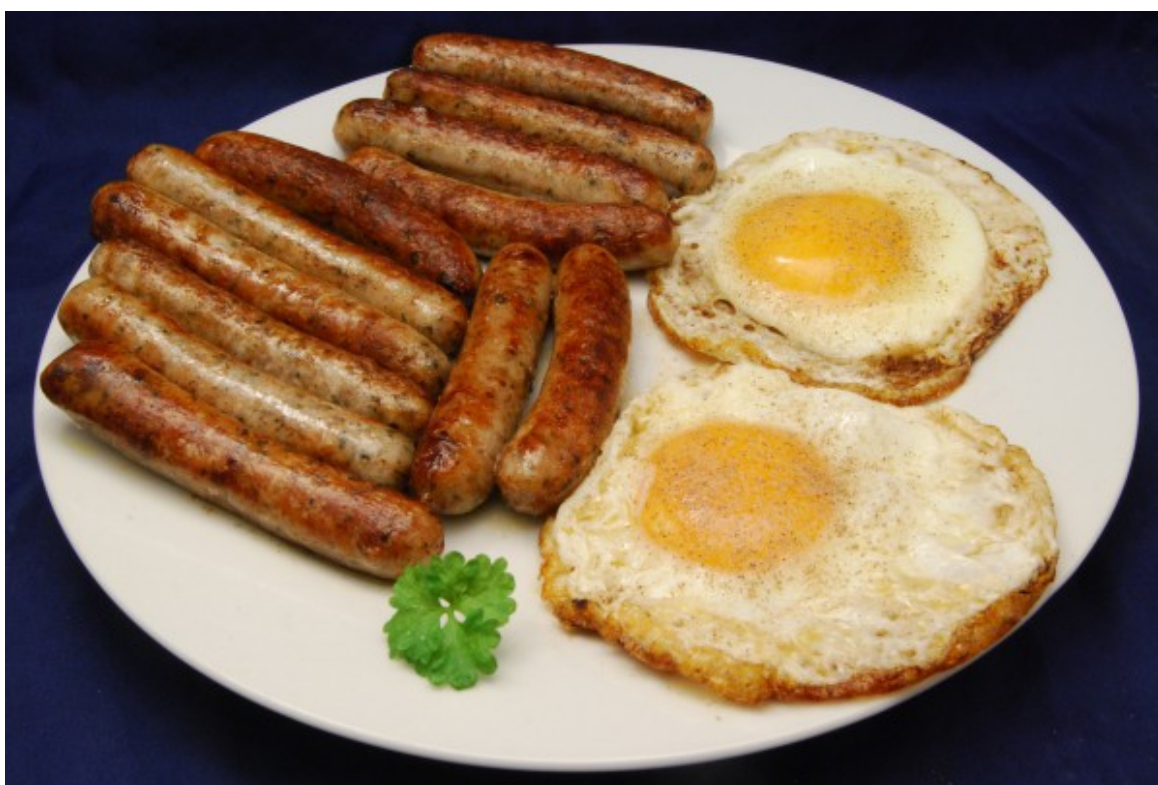
Würstchen mit Eiern

Heute nichts Besonderes oder gar aufwändig zu Kochendes. Nein, relativ einfach und schnell zuzubereiten. Einige original Nürnberger, dazu Spiegeleier. Letztere aber zumindest im Eierring zubereitet, damit es für das Auge etwas schön aussieht.