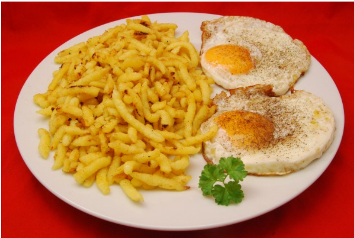
Pasta mit Eiern