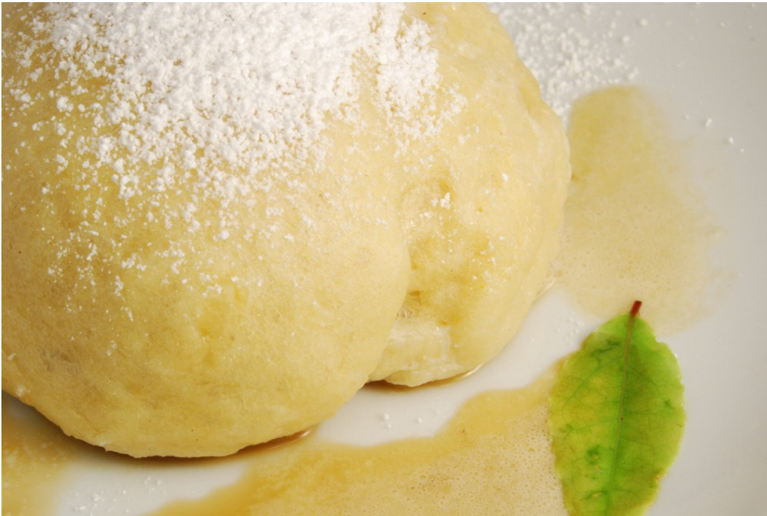
Dampfnudel mit Zabaglione, mit Puderzucker garniert

Das ist doch mal wieder eine so von Gott gegebene Sache. Ich lag heute Nacht im Bett und überlegte, dass es einmal an der Zeit wäre, zu prüfen, wieviele Fotos ich schon über meine Bild-Agentur Fotolia verkauft habe. Denn dort biete ich in meinem Portfolio mittlerweile seit 3–4 Jahren meine besten 400 Foodfotos aus meinem Foodblog an. Angesichts der in meinem Portfolio mittlerweile vorhandenen Foodfotos sollten doch schon mehr als 100 Foodfotos verkauft worden sein.