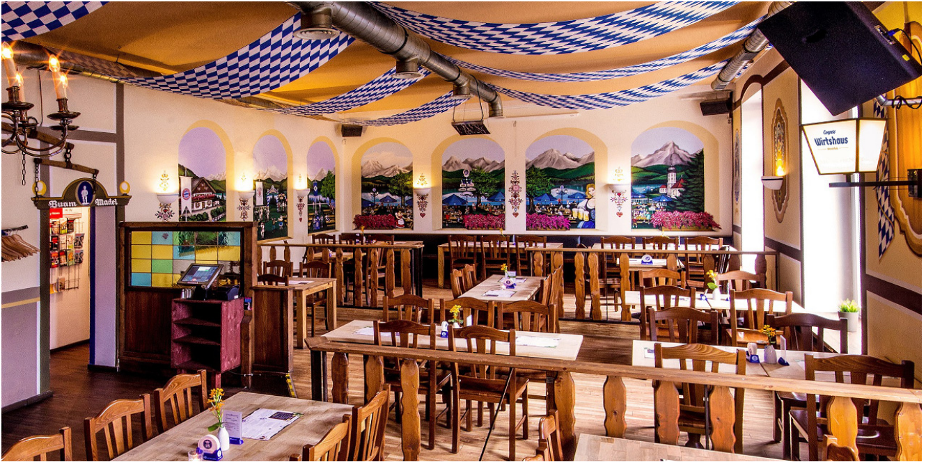
Innenraum der Wirtschaft

Und so sah dann das Gericht im Ganzen aus: