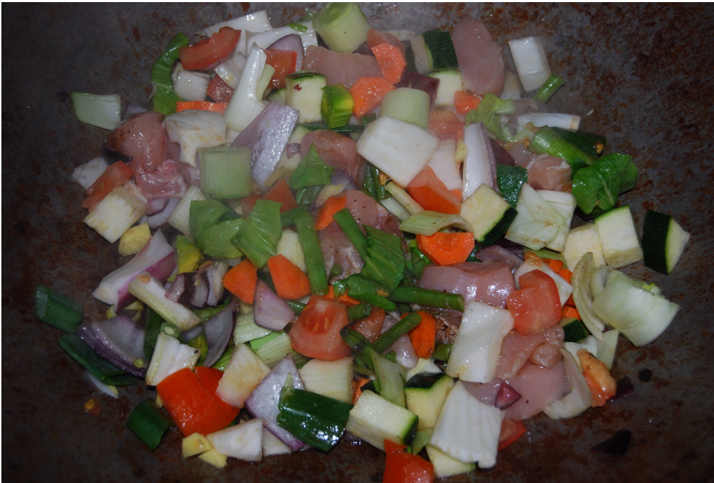
Zutaten im Wok

Die Sauce bereite ich mit rotem Thai-Curry zu. Ich verlängere die Sauce mit trockenem Weißwein.