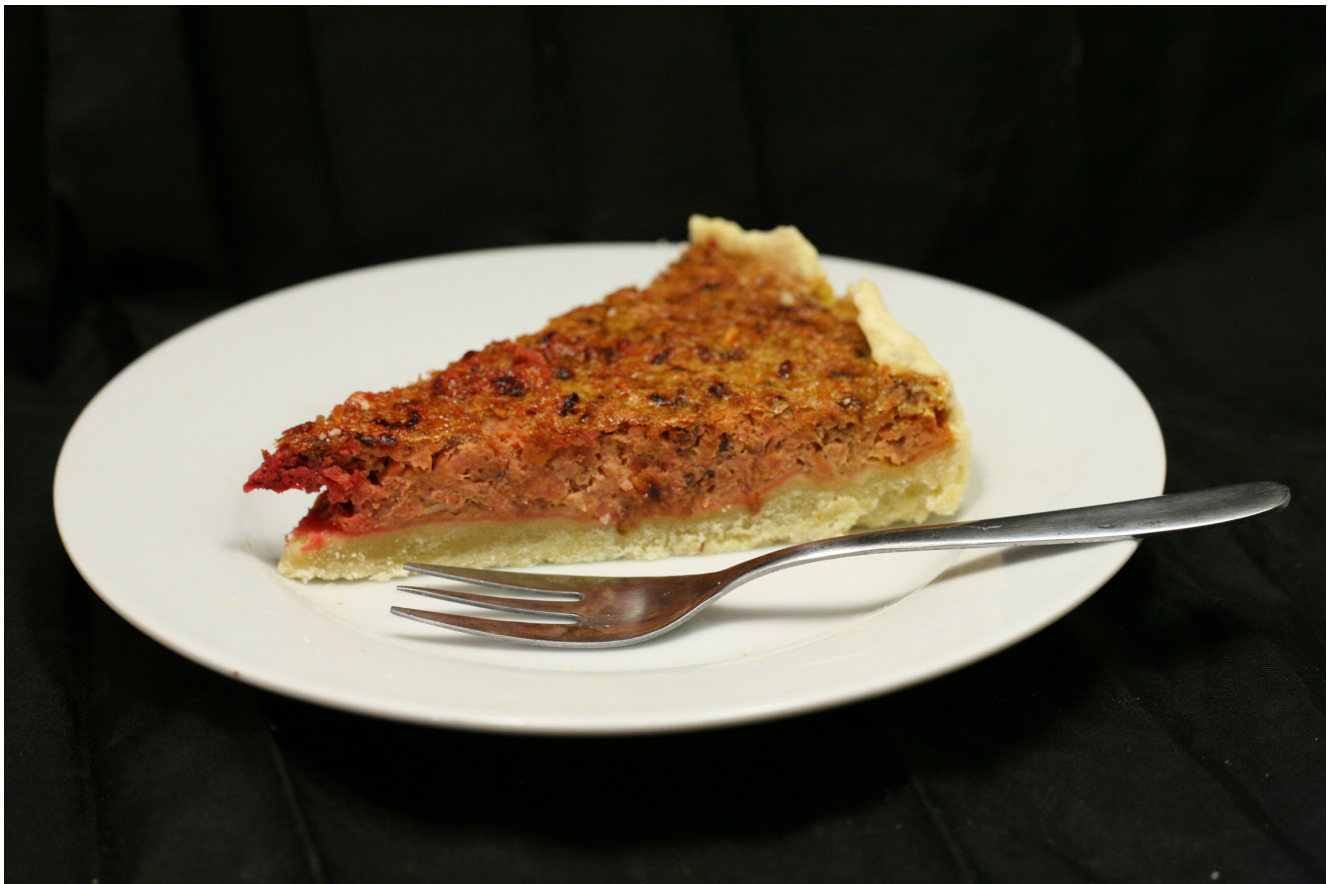
Würzige und schmackhafte Tarte