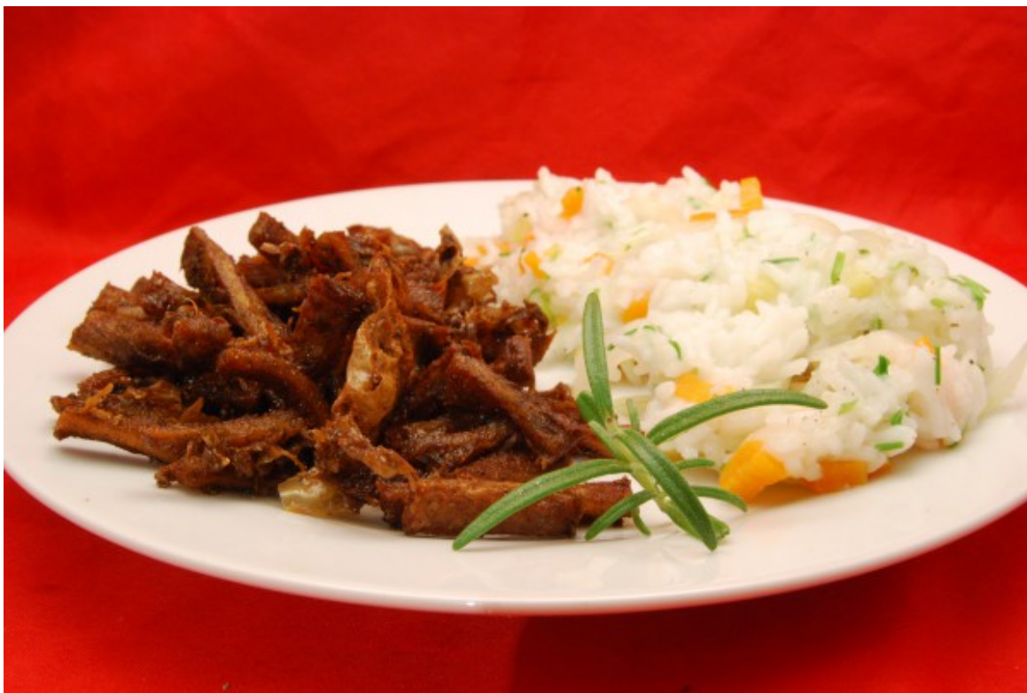
Knuspriger Pansen mit Gemüse-Reis

Wenn man Pansen im Gemüsefond gart, kann man gleich eine größere Menge zubereiten, denn das Garen dauert ja einige