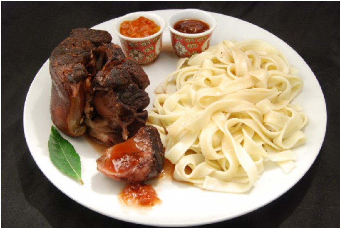
Schweinshaxe-Scheibe mit Dips, Pasta und Rotweinsauce

Zubereitungszeit: Vorbereitungszeit 5 Min. | Marinierzeit 4 Stdn. | Garzeit 2 Std.