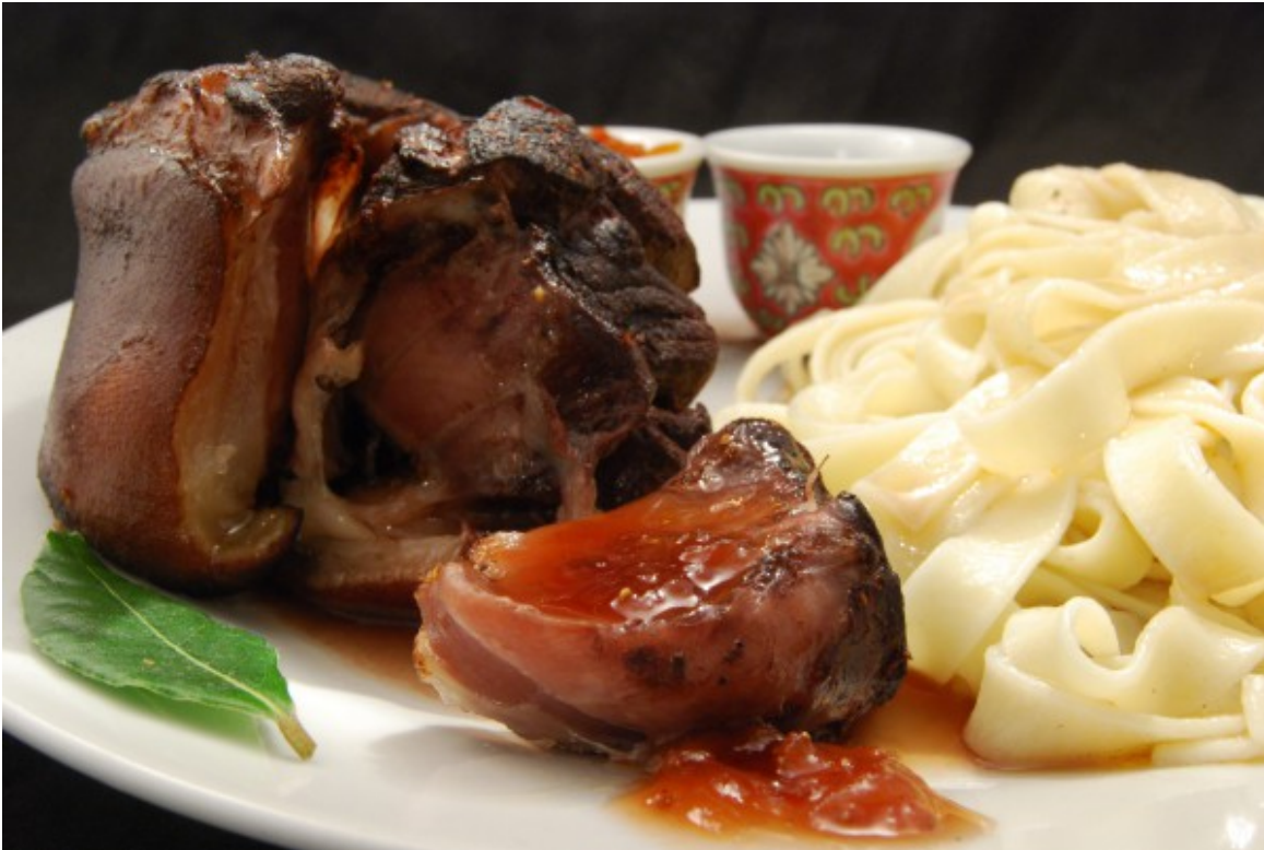
Haxe mit Currysaucen- und Marmeladen-Dip und Pasta

Das Team des „Fillet of Soul“ hatte mich zu einem Besuch in seinem Restaurant und einem Essen eingeladen. Ich hätte dann in einem Blogbeitrag darüber berichtet. Ich bin allerdings zur Zeit in einer zahnmedizinischen Behandlung und scheue etwas die Öffentlichkeit. Deshalb habe ich leider abgesagt.