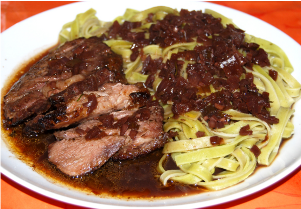
Angerichtete Lammkeule mit Pasta und dunkler Sauce

Sie können zu diesem Gericht aber auch Reis, Knödel oder Kartoffeln zubereiten.