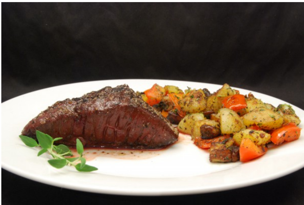
Gebratene Leber mit Gemüse

Vor kurzem kam ich auf die Idee, auch einmal Innereien mit der Niedrigtemperatur-Garmethode zuzubereiten. Ich entschied mich für Rinderleber. Die Leber war nach der Zubereitung gegart, auch wenn sie äußerlich ungewöhnlich aussieht. Ich brate sie auch erst nach dem Garen im Backofen an und würze sie erst dann.