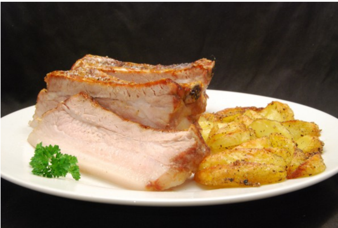
Gegrillte Schweinebauchscheiben und Kartoffeln

Schweinebauch hatte ich ja schon auf vielfältige Weise zubereitet – gebraten, paniert, gegrillt, gekocht, gefüllt, als Porchetta. Jetzt wollte ich ein weiteres Mal ein großes Stück Fleisch mit der Niedrigtemperatur-Garmethode zubereiten und entschied mich hierbei für Schweinebauch. Ich brate den Schweinebauch vorher nicht an, wie man es bei dieser Art der Zubereitung gewöhnlich macht. Denn ich grille ihn nach dem Garen unter dem Backofengrill für eine schöne, krosse Kruste. Ich entferne vorher auch nicht die Schwarte, denn diese gibt