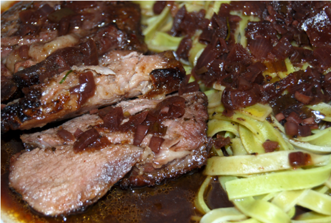
Lammkeule mit Fettuccine verde in dunkler Sauce

Lange geplant, jetzt endlich ausgeführt: Lammkeule mit der Niedrigtemperatur-Garmethode zubereitet. Die Lammkeule mit ca. 1 kg Gewicht und einem Knochen brauchte 4 \frac{1}{2} –5 Stdn. im Backofen bei 80 °C. Danach war sie butterweich und zart. Ich habe sie zuerst über Nacht mariniert. Das Rezept ist für 3 Personen.