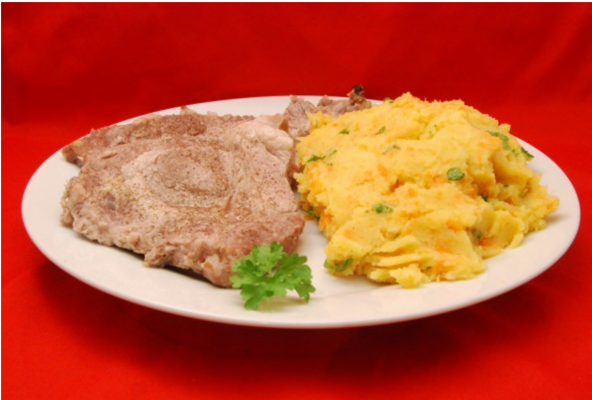
Pochierte Koteletts und farbenfroher Stampf

Ein experimentelles Essen. Und, ich muss sagen, es ist mir gelungen. Aber ich fange von vorne an zu berichten.