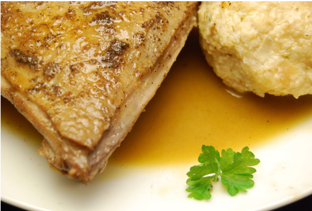
Schenkel und Knödel in leckerer Sauce

Ich freue mich auf den Sonntag. Man hat Ruhe, kann in Ruhe einige Dinge machen und seine Batterien aufladen. Weil die normalen Alltags-Dinge wegfallen. Und am auf den Sonntag darauffolgenden Montag kann man mit neuer Kraft in den Alltag starten. Und ich freue mich immer auf das Frühjahr, das ist meine bevorzugte Jahreszeit. Denn sie hat am meisten Feiertage. Eigentlich sollte es für den Sonntag auch noch einen Kuchen geben. Eine Trauben-Tarte? Oder doch vielleicht eher frisch aufgebackene Brötchen? Mit einem schönen Walnuss-Honig?